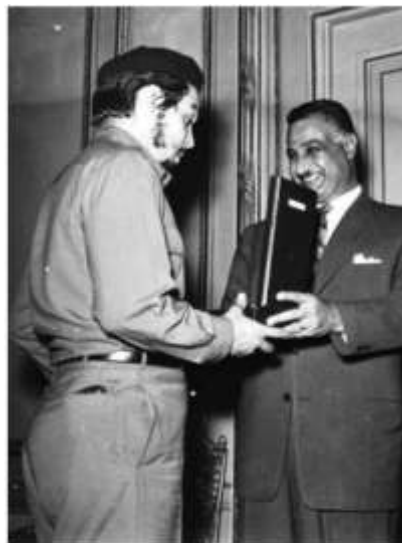
Ernesto Guevara en misión diplomática saluda a Gamal Abdel Nasser

Durante la década de 1950, el coronel egipcio Gamal Abdel Nasser se transformó en un líder del mundo árabe. El nacionalismo sustentado por Nasser se basaba en la afirmación de una identidad árabe, africana y musulmana. Pero su postura tenía un fundamento económico sólido: la producción petrolera que el mundo árabe proporcionaba al mercado internacional, que respondía a la creciente demanda de combustible de la posguerra.