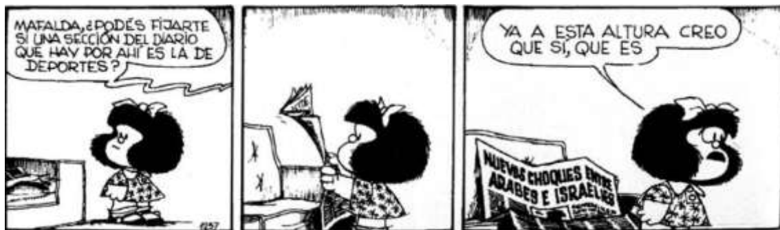
Mafalda, por Quino

Explica con tus palabras qué piensa Fanon sobre la responsabilidad de Europa con relación a los países coloniales o recientemente liberados.